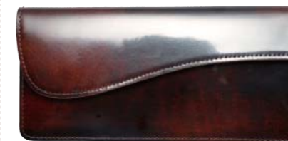
ゼブラウォレット4 ZEBLA WALLET 4 価格1万9440円

独創性と徹底したこだわりを追求したうすマチタイプの長財布。内側の小銭入れにはファスナーがないためストレスフリーの使用感が味わえる。札入れ×2、小銭入れ×1、カード入れ×9、フリーポケット×2、サイズ:縦20×横9×幅2.5cm