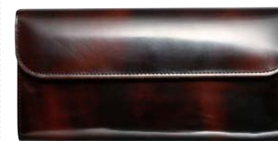
レパードウォレット5 LEOPARD WALLET 5 価格2万8080円

鞣す工程で淡色で仕上げられた革の上にベールという濃色の仕上げ液を塗布する。その後、仕上げの最終段階に塗布したベールを部分的に落とし色調の濃淡をつけることで独特の美しい風合いを生み出す。