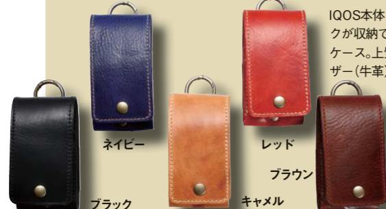
クックアイコスケース11 CUCKOO IQOS CASE 11 価格4644円

IQOS本体とヒートスティックが収納できる便利なIQOSケース。上質なイタリアンレザー(牛革)製。取り外しできるカラビナ付き。カバンやボトムのベルトループにぶら下げ可。サイズ:縦15×横6.5×幅6cm