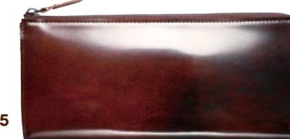
ゼブラウォレット5 ZEBLA WALLET 5 価格2万5920円

イタリアンレザー(牛革)にアドバン加工を施し、ハンドメイドで磨いた美しい光沢が特徴のかぶせタイプの長財布。札入れ×3、小銭入れ×1、カード入れ×12、フリーポケット×3、サイズ:縦9.5×横19.5×幅3.3cm