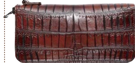
ビューマウォレット15 PUMA WALLET 15 価格10万8000円

美しさ、強度、希少性から「皮革の宝石」と呼ばれ、古くから高級品や贅沢品として世界中の「本物」を求める人々から今もお愛され続けているマテリアルだ。