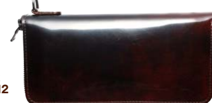
ビューマウォレット12 PUMA WALLET 12 価格2万7000円

美しい光沢が特長のうすマチタイプの長財布はビジネスシーンにも◎。カードは重ねて3枚収納可能。1万円札もびったり収納できる。札入れ×1、小銭入れ×1、カード入×1、フリーポケット×1、サイズ:縦9×横18.5×幅1.5cm