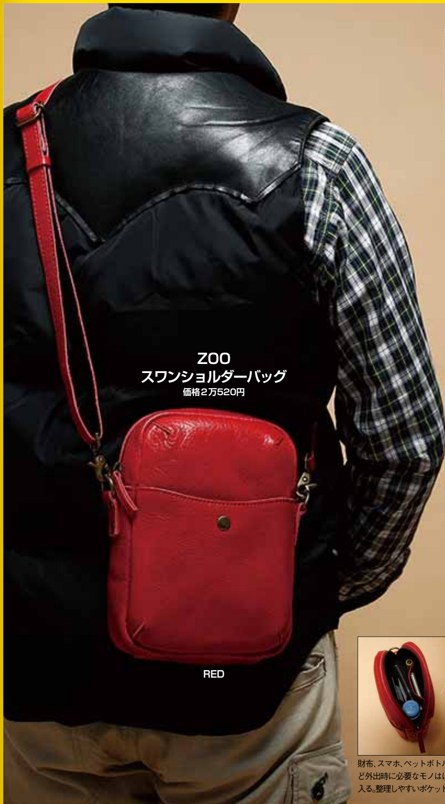
サイズ:高さ24×幅19×マチ6cm 素材:牛革(姫路レザー) 全6色

レザー製品のどこに魅惑を感じるか？と聞かれたら、長く使えて経年劣化が楽しめる素材のタフさと答える人も多いはずだ。でも、その魅力は表裏一体。手に馴染むようになるまで時間がかかるレザーの硬さがどうも好きになれないという人も多いのかもしれない。 動物名を冠したオリジナル商品を展開する新進気鋭のレザーブランド「ZOO(ズー)」は、そんなレザーの特性を活かしながら、デメリットを克服。姫路の熟練革職人と試行錯誤を繰り返し、手にした日からしっくりくる柔らかさと使った時に風合いが増すレザー特有の素材感を両立させることに成功した。 その絶好の素材を用いて仕立てた「スワンショルダーバッグ」には、常にもち歩きたくなる仕掛けがいっぱい。外側の両面にそれぞれひとつずつアウターポケットが付いているし、メインポケットの中には分けて収納できるフリーポケットを備えている。メインポケットだけでも財布やスマートフォン他、タバコなどの小物も入るので、幅広いシーンで重宝するはずだ。 しかも無駄のないシンプルなデザインだし、愛着の増すエイジングが楽しめる6色を揃えているから、男女を問わず個性に合わせてセレクトできる。プレゼントにも喜ばれること間違いナシだから、あの子と一緒に使い始めて、共に同じ時間を過ごしながら少しずつ熟成を深めていく、素敵な歳の重ね方を共有することもできるのだ。